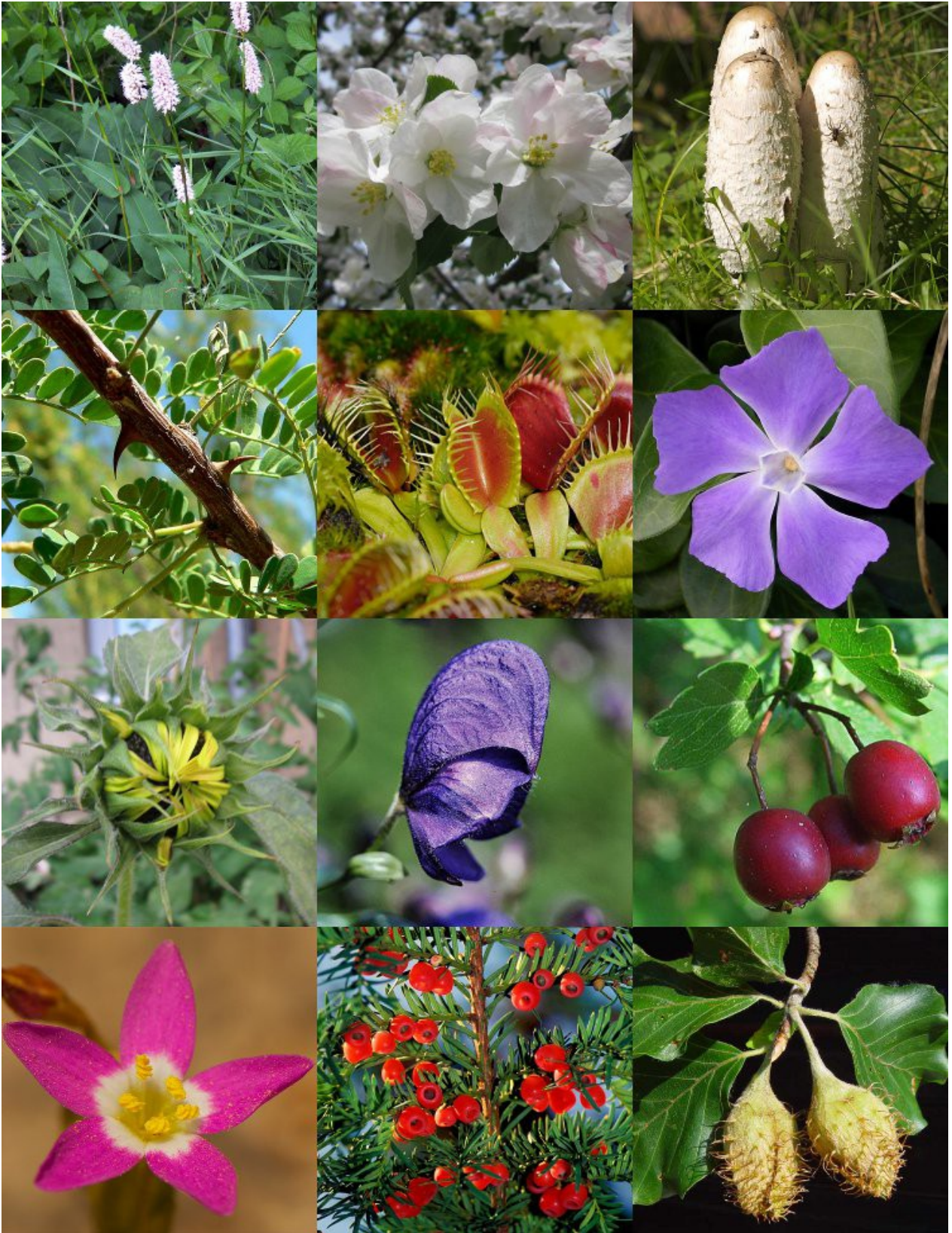
Wiesenknöterich – Persicaria bistorta | Apfel – Malus domestica | Schopftintling – Coprinus comatus Araukarie – Acacia | Venusfliegenfalle – Dionaea muscipula | Immergrün – Vinca major Sonnenblume – Helianthus annuus | Eisenhut – Aconitum napellus | Weißdorn – Crataegus monogyna Tausendgüldenkraut – Centaurium | Eibe – Taxus baccata | Rotbuche – Fagus sylvatica