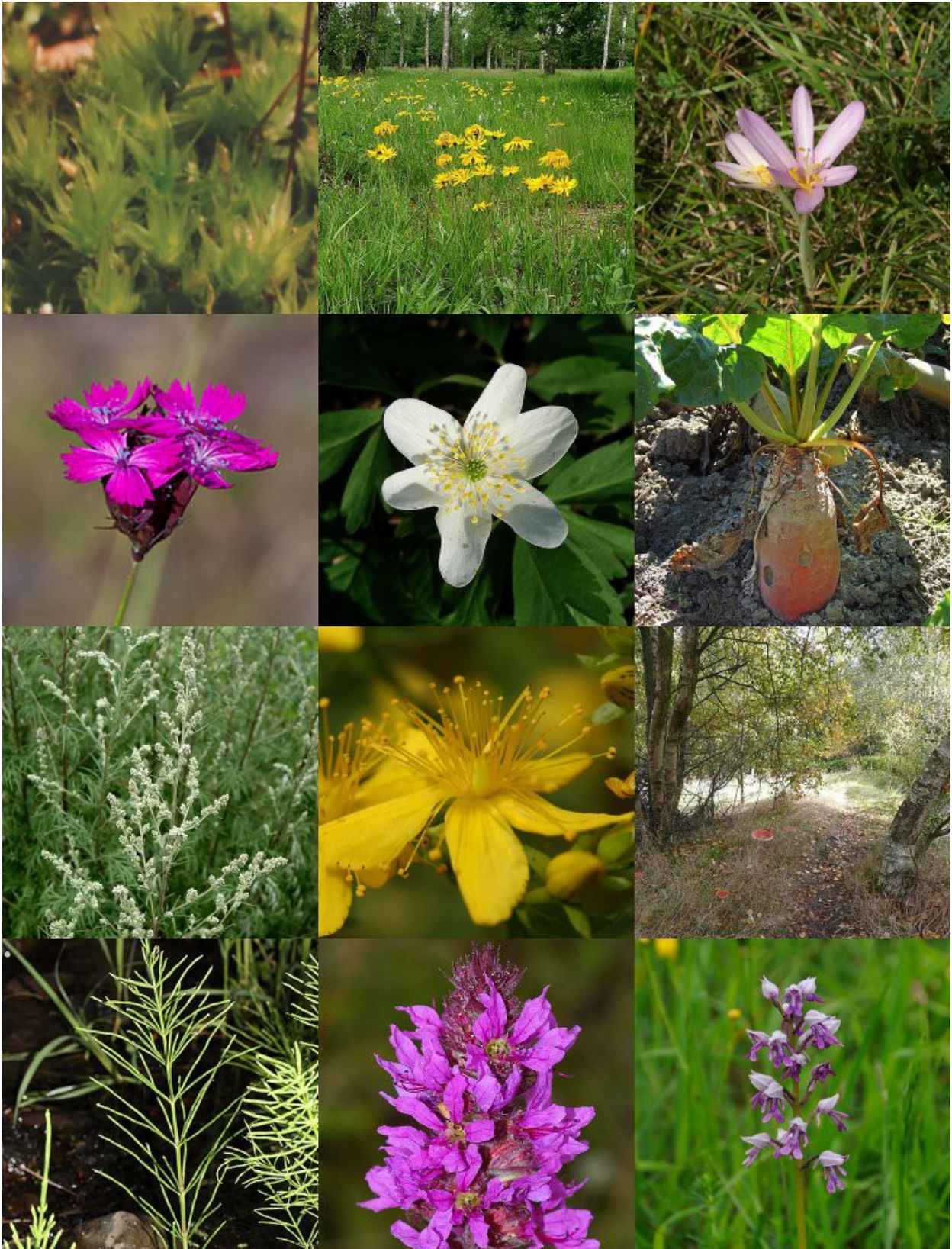
Sternmoos – Pohlia nutans | Arnika – Arnica montana | Herbstzeitlose – Colchicum autumnale Karthäusernelke – Dianthus carthusianorum | Buschwindröschen – Anemone nemorosa | Zuckerrübe – Beta vulgaris Beifuß – Artemisia vulgaris | Johanniskraut – Hypericum perforatum | Birke – Betula pendula Ackerschachtelhalm – Equisetum arvense | Blutweiderich – Lythrum salicaria | Knabenkraut – Orchis militaris