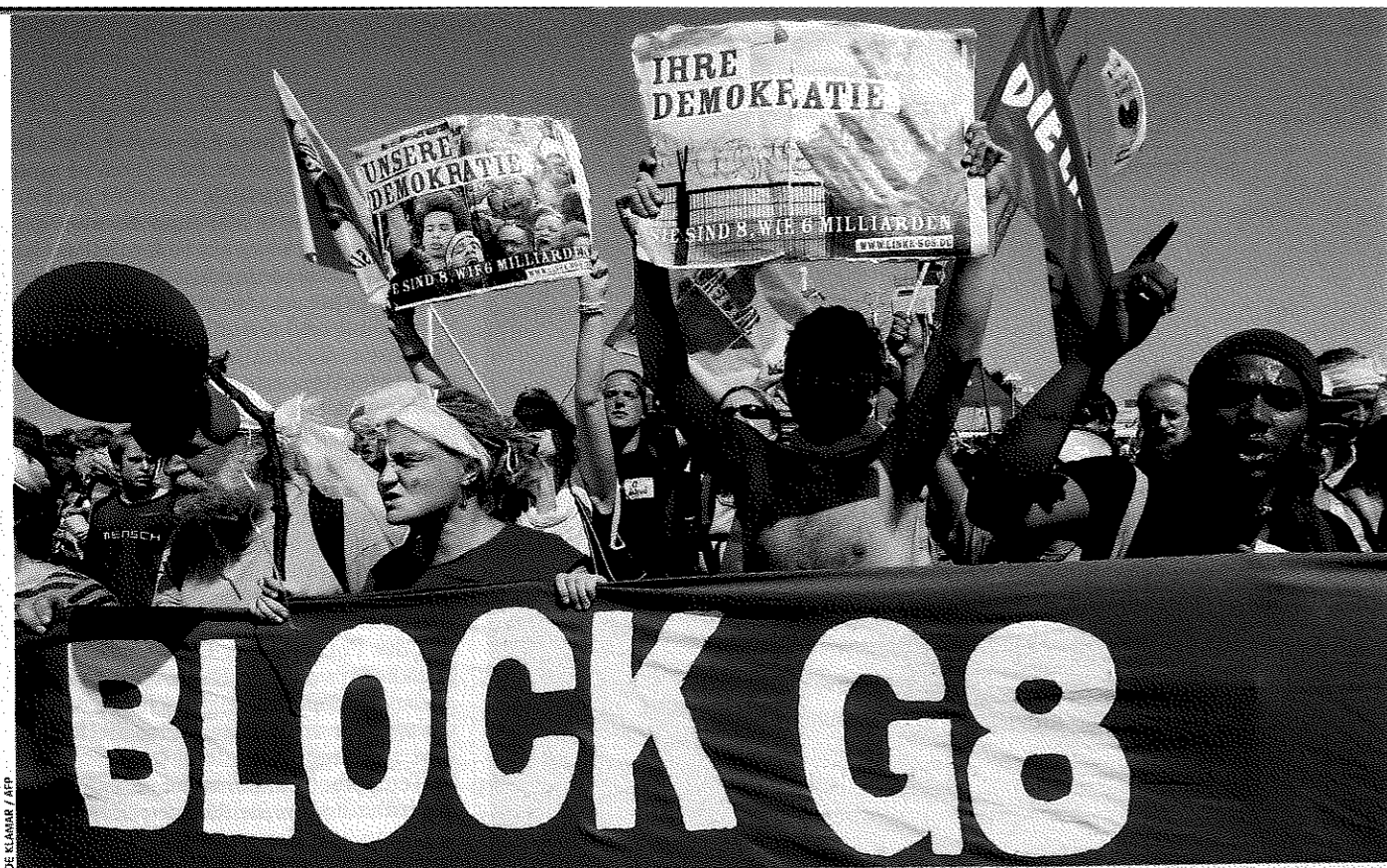
Anti-G-8-Proteste in Rostock 2007: Aktivisten für militante Einsätze mobilisiert